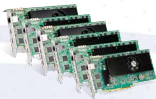
Matrox Mura IPX Capture系列