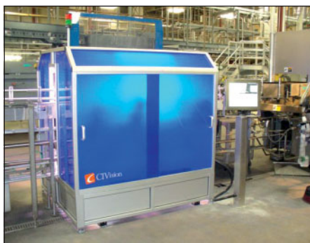
Das 360 Full View verfügt über ein um das Transportband gebautes Aluminiumgehäuse mit einem seitlich angebrachten Touchscreen für den Bediener

diesen ebenen Bildern der Flasche werden durch das Registration Modul der MIL die gemeinsamen Bereiche (die sich überlappenden Bereiche der Bilder) bestimmt, die Kanten der Etiketten präzise lokalisiert und ein zusammengesetztes Bild erstellt. Dieses Bild ist so aufgebaut, dass zuerst das Frontetikett erscheint, dann das hintere Etikett und schließlich ein weiterer Teil des Frontetiketts. Somit kann der Anwender die gesamte Oberfläche der Weinflasche in einem diskreten Bild sehen. Die Position der Etiketten kann durch ihre Koordinaten im zusam-