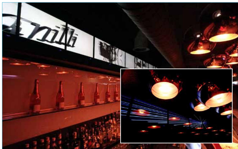
Im Club Vanilli versorgen 15 Matrox TripleHead2Go das Display-Band für eine ultra-moderne Club-Atmosphäre.