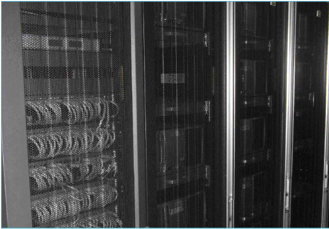
Extio延伸技术令所有工作站都可以安全地安装在HP 42U机架机柜里。

除了工作站的设计问题之外，1-0-7紧急救援服务中心的经理还认为应该更好地保护康柏工作站，提高紧急服务中心的安全水平。经理们担心所有操作人员都可以随时处理，修改和移动系统为服务带来隐患。